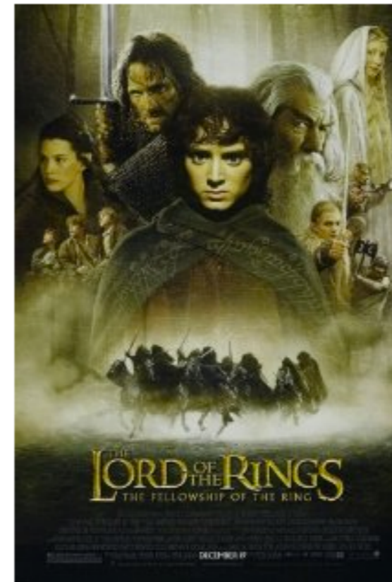
Lord of the Rings